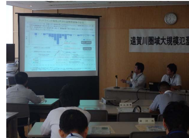
遠賀川河川事務所から情報提供等