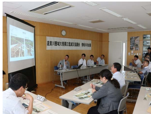
添田町からの報告